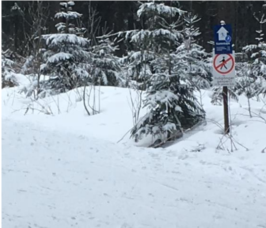
...in der Loipe nur Skifahren erlaubt :)

Tag auf unserer Tour nach Carlsfeld schneite es - nicht so ganz zum momentanen Vergnügen- der frische Pappschnee ließ uns auch fluchen. Aber die nunmehr sinkenden Temperaturen zauberten aus dem Vogtland ein wahres Glitzer-Wunderland, das wir bei blauem Himmel und Sonnenschein herrlich genießen konnten. Eine schöne Abwechslung war vor allem für die Kinder der Tag am Skihang, wo selbst die Kleinste nach einem Kurzunterricht beim Skilehrer dann den Hang runter kurvte und die Größeren ihre Fähigkeiten an der Minischanze testen konnten.